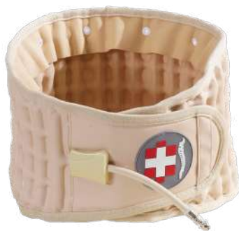
Lombatrax van Alphay

De Lombatrax wordt zowel curatief als preventief ingezet.