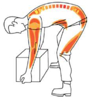
Schets van een verkeerde tilhouding zonder Ergoskeleton