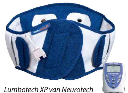
Lumbotech XP van Neurotech

Lumbotech is een rugbandage met ingebouwde elektrostimulatie die zowel pijnstillend ( curatief ) als spierversterkend ( preventief ) kan gebruikt worden. De bandage is gemaakt van ademend en huidvriendelijk materiaal met individuele aanpassingen.