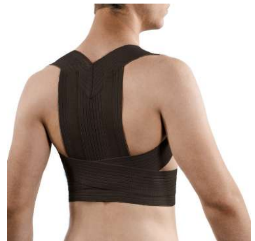
Clavithor Posture Support van Mediroyal

Zij krijgen bij het gebruik van deze bandage extra steun.