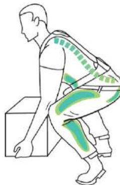
Schets van een juiste tilhouding met Ergoskeleton